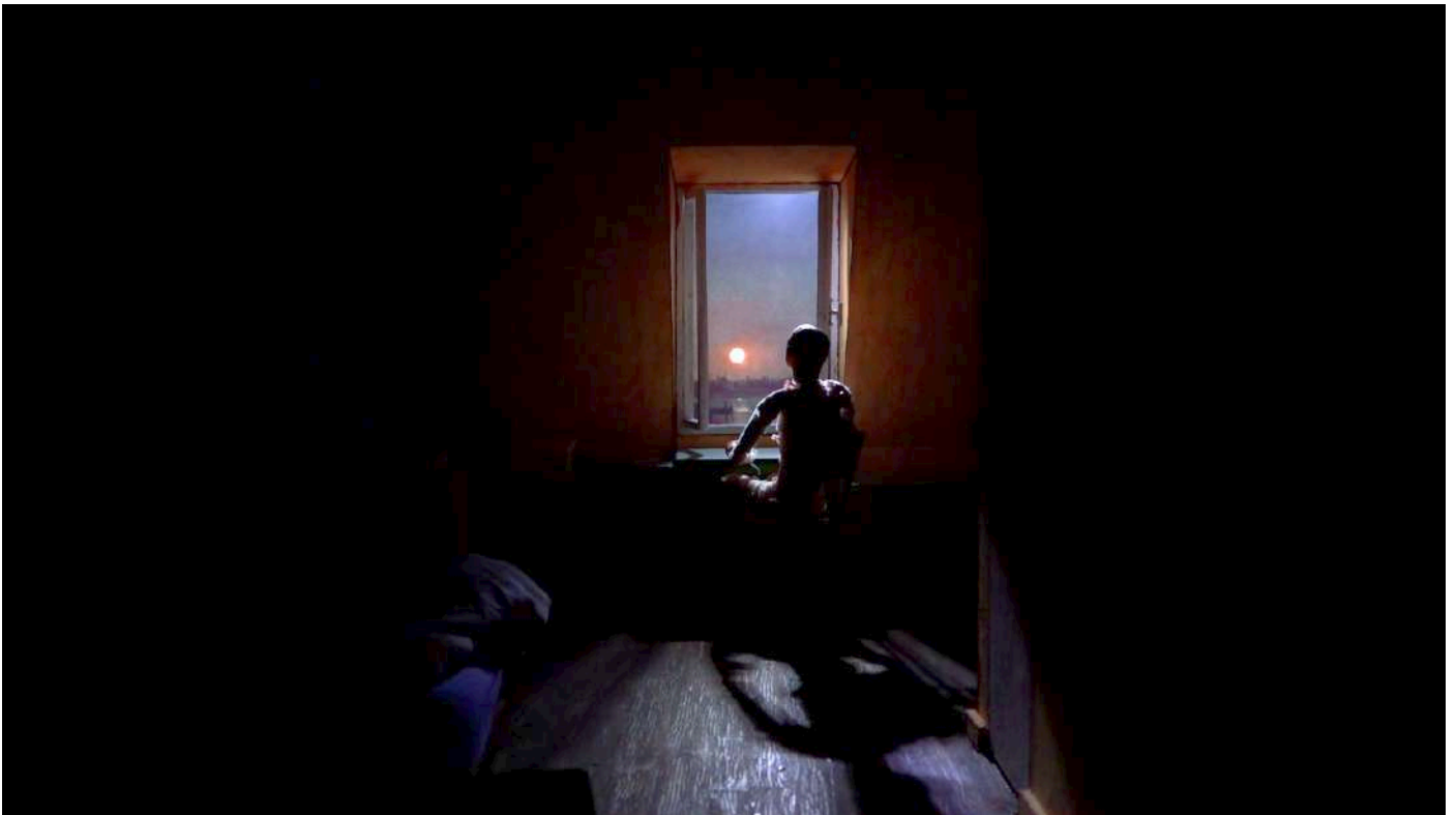
Intérieur chambre - Maquette

L'exposition vient compléter ces deux premières propositions, en montrant l'envers du décor, les étapes de recherche, les croquis préparatoires, le story-board ou encore des installations réalisées à partir de calques montrant les principes de l'animation en image par image ou comment créer un mouvement à partir de six ou sept dessins fixes.