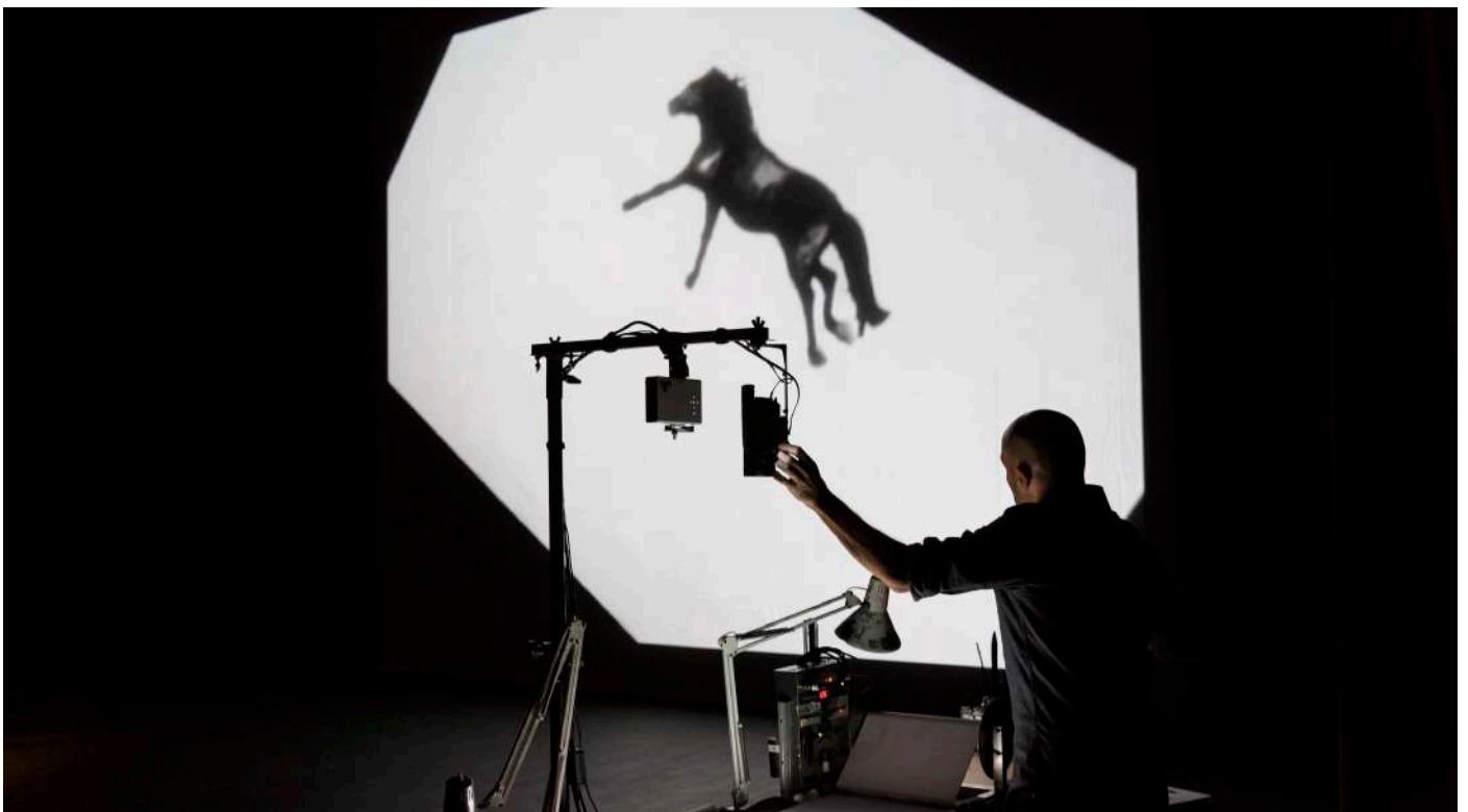
Extrait du spectacle DARK CIRCUS