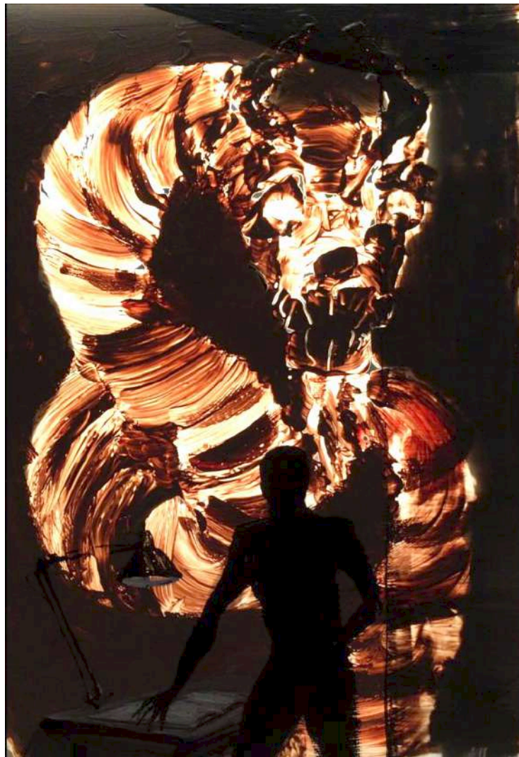
Peinture de recherche - apparition de créature