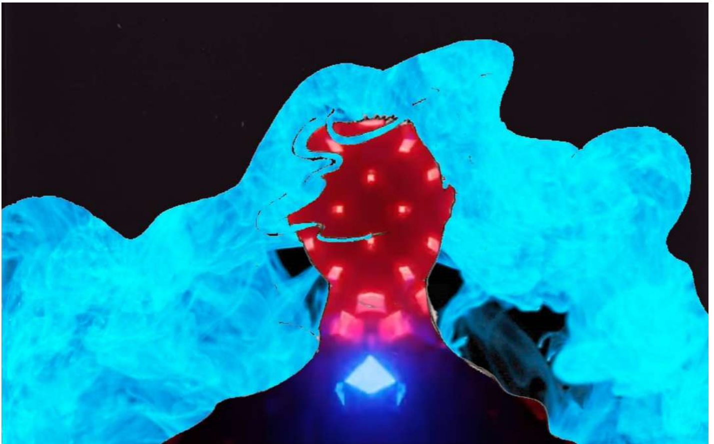
Créature chimérique - Dessin et incrustation