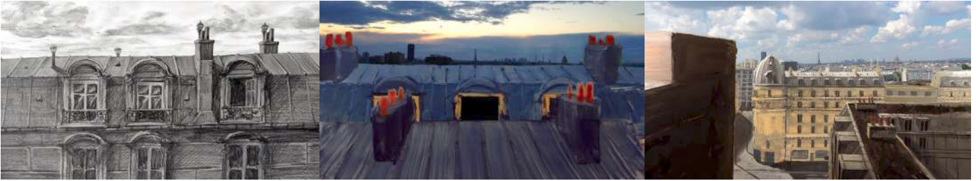
Dessin et Peintures de recherche - extérieur chambre