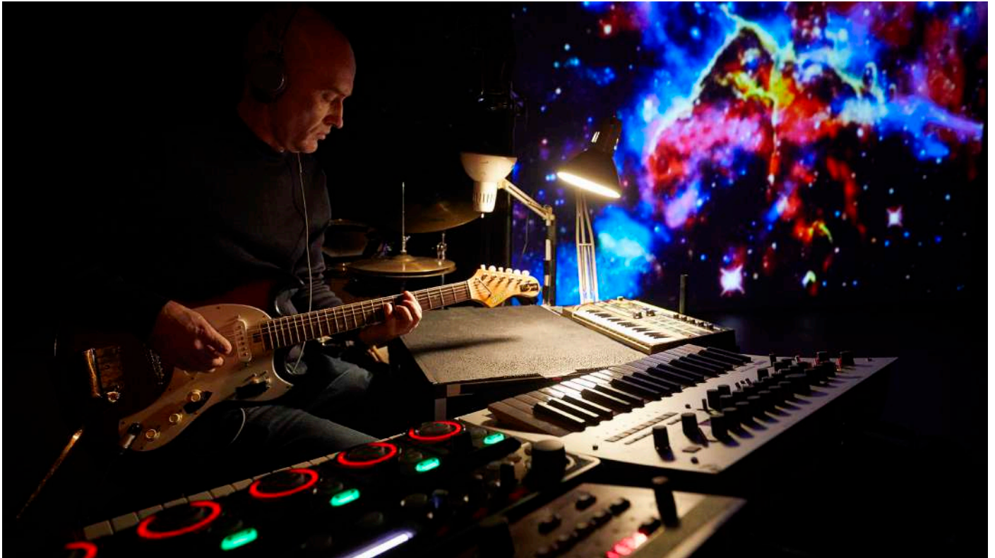
Extrait du spectacle STELLAIRE