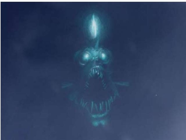
Poisson des abysses - Dessin animé