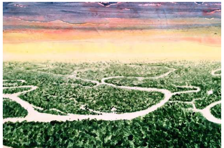
Amazonie- Décor déroulant peint © Stereoptik