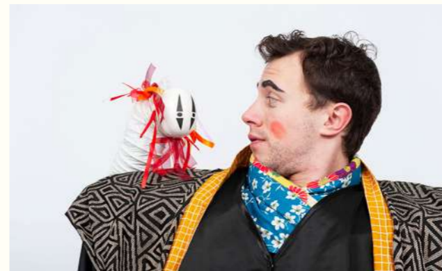
DR La Magouille

On fait la rencontre de Charlisan, un personnage joyeux et plein de poésie. Un jour, mystérieusement, un Yokaï se révèle et vient le taquiner puis progressivement l'envahir. Courageux, il se met alors au défi de combattre cette créature étrange. Il lui faudra au moins la force des samouraïs pour y parvenir, coûte que coûte.