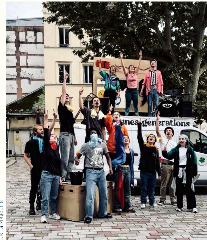
DR La Magouille