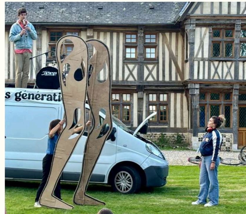
DR La Magouille

Se côtoient musiques révoltées d'hier et d'aujourd'hui. Sa recherche s'accompagne de percussions diverses, d'un micro et d'une flûte à bec baroque. Les voix des 3 interprètes chantent innocemment un air aux paroles engagées telle la Marseillaise des cotillons ou encore le slam du réconfort .