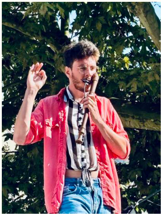
La Magouille