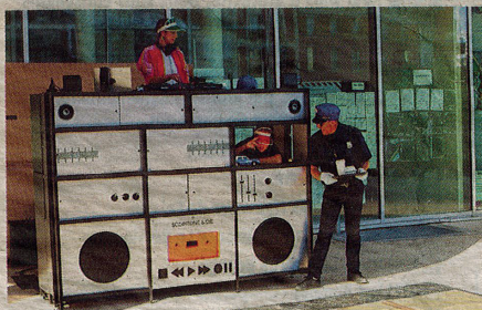
Hand Hop de Scopitone et Cie. Jérémie Jung

■ Tarifs : 10 € (plein), 8 € (réduit). Possibilité de pass à partir de 3 spectacles (8 € la place ou 6 €). Ateliers enfants-parents : 8 € le binôme. Réservations au village du festival ou avant chaque spectacle du soir. Contact : 02 31 82 69 69 ou billetterie@le-sablier.org Programmation sur https://le-sablier.org/