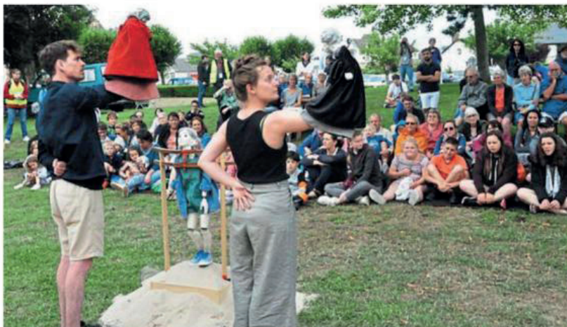
À Dives-sur-Mer, le festival RéciDives se poursuit jusqu'à demain, en divers endroits de la ville.