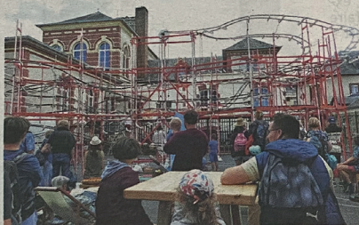
Au village, une œuvre vivante attire les spectateurs.