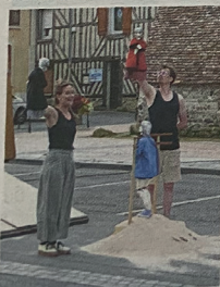
« Le temps d'un cri » sur la place de la République.