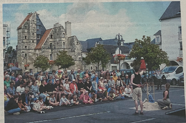
La 37 e édition de RéciDives a débuté mercredi avec notamment des spectacles en plein air.