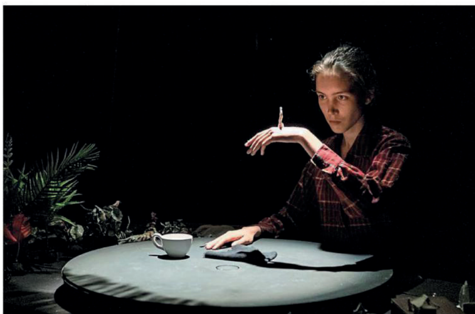
« Le rire des oiseaux », par la compagnie Formosa Theater, théâtre d'objets en céramique, formes animées et illusions, jeudi 13 et vendredi 14 juillet, à Dives-sur-Mer.