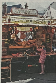
A la remorque-atelier Pistacol, on prépare masques et costumes pour la retraite aux « Flambos ».

Jusqu'au 15 juillet, le Sablier, centre national de la marionnette, organise la 37 e édition de son festival de théâtre de marionnettes et formes animées, RéciDives. L'occasion pour les festivaliers de découvrir la diversité de cette discipline artistique.