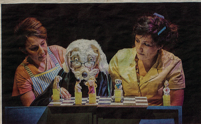
Monologue dun chien bien coiffe, par la compagnie Toutito Teatro.

Depuis 37 ans, le festival « présente la diversité et l'actualité du théâtre de marionnettes, il est ainsi à la fois le témoin et le passeur des évolutions esthétiques de cette discipline artistique » souligne Anne Decourt, directrice du Sablier. Un festival profondément ancré dans son époque, à l'image des artistes qu'il programme, « à chaque édition, certaines thématiques se font plus fortes, prouvant une fois de plus que les artistes se font l'écho des questionnements contemporains et des inclina-