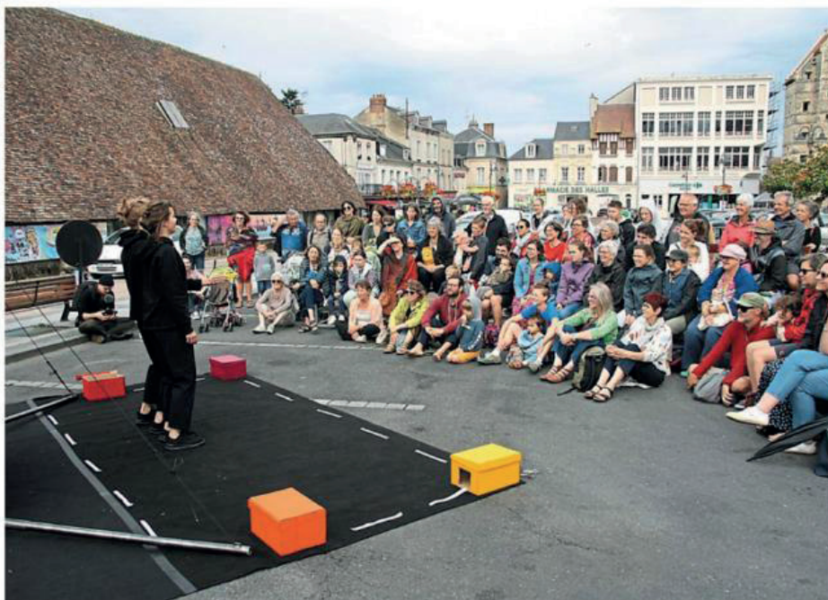
Les applaudissements et les rires ont démontré que le public appréciait le spectacle.